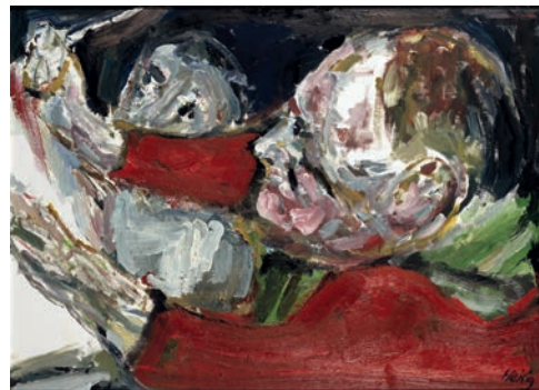
»Der Maler«, 2010, Öl auf Leinwand, 50 x 70 cm

Mit den Bildern von Bernhard Heisig zeigen wir in der Hofgalerie eine am Kurfürstendamm sehr vertraute Position. Bei unserem Start im Januar für dieses Jahr noch nicht eingeplant, hat der Tod Bernhard Heisigs unser Jahresprogramm verändert. Eine Hommage an einen Maler, mit dem auch das neue Team der Hofgalerie schon mehr als 20 Jahre zusammengearbeitet hatte und der natürlich in der privaten Sammlung Rosendahl & Thöne vertreten ist.