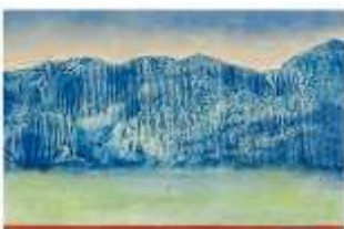
15. Max Ernst (1891-1976) "Montagne bleue - Wüstenlandschaft" 1950 Gouache auf festem Velin 16,3 x 23,9 cm wird in den Supplementband des Wvz. aufgenommen, Arbeitsnummer 256 A Seite 3/6