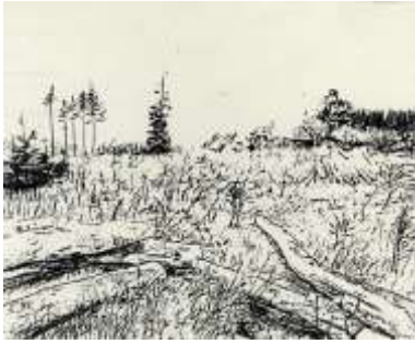
11. Wolfgang Mattheuer (1927-2004) "Holzplatz" 1976 Bleistiftzeichnung 70 x 84,8 cm Wvz. 78 Lager-Nr. BE 2652