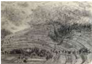
12. Wolfgang Mattheuer (1927-2004) "Am Fichtelberg" 1955 Lithokreide 21 x 30 cm Lager-Nr. BE 2666