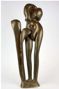
16. Emil Cimiotti (geb. 1927) „Elvira“ Bronze, geschliffen, 1966 58 x 21 x 10 cm Wvz. Brusberg 111 Auflage 7 Exemplare Lager-Nr. BK 16000