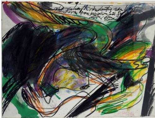
17. Walter Stöhrer (1937 – 2000) „Chassidischer Körper – für Titus Szymanski“ Gouache auf Papier, 1978 57 x 76,5 cm bez., dat. und sign. o.r. Lager-Nr. BK 16014 Geschenk von Walter Stöhrer