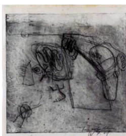
20. Walter Stöhrer (1937 – 2000) Ohne Titel Radierung, 1961 26 x 24,2 cm Wvz. Radierungen 1961.5 Geringe Auflage, Eigendruck monogr. und dat. u.r. W.St. 61 Lager-Nr. BK16010