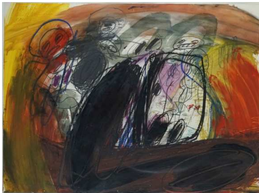
18. Walter Stöhrer (1937 – 2000) Ohne Titel Mischtechnik und Collage auf Papier, 1967 62 x 84 cm u.: W. Stöhrer an R. Szy. 8.7.67 Lager-Nr. BK 16013