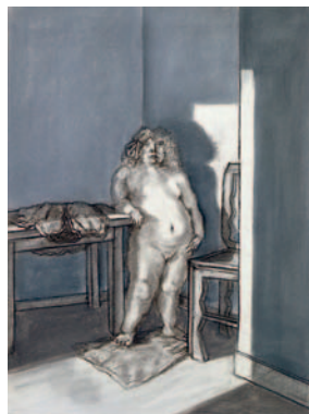
Untitled (Standing Female Nude) Kohle und Pastell auf Papier, 1976 75,6 x 55,9 cm Lager-Nr. BK 15400