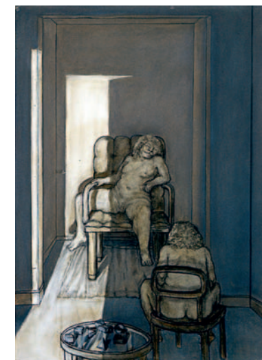
Untitled (Seated Nudes) Kohle und Pastell auf Papier, 1976 106,7 x 75,6 cm Lager-Nr. BK 15403

– eine Hommage Bilder und Blätter aus den 70er Jahren