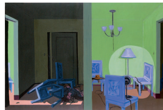
»Apartment« Öl/Acryl auf Hartfaser, 1970 81,3 x 121,9 cm Lager-Nr. BK 15381