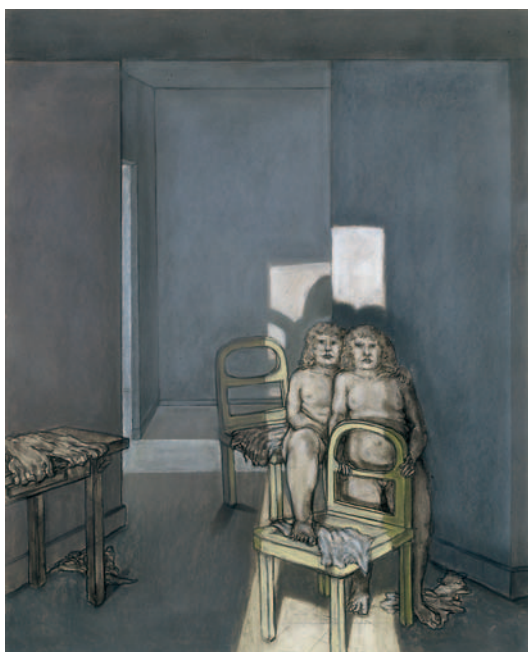
Untitled (Nudes with Two Chairs) Öl, Kohle und Pastell auf Bainbridge Board #80, 1976 125,1 x 101,6 cm Lager-Nr. BK 15399