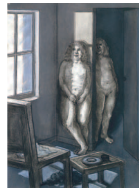
Untitled (Standing Nudes) Kohle und Pastell auf Papier, ca. 1976 76,2 x 56,5 cm Lager-Nr. BK 15402