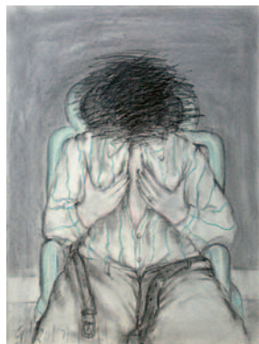
Untitled (Man in Green Chair) Pastell, Kohle und Graphit mit Acryl auf Arches Papier, 1971 76,8 x 57,2 cm Lager-Nr. BK 15409