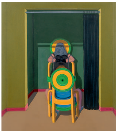
»First Interview« Acryl und Pastell auf Hartfaser, 1970 86 x 75,5 cm Lager-Nr. E 6614