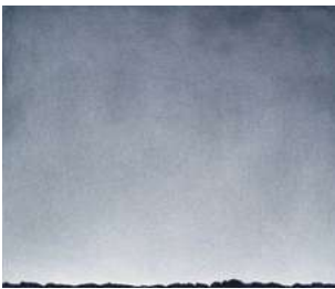
7. Bertram Hasenauer (geb. 1970) „Untitled“ 2013 Farbstift auf Papier 40 x 47 cm Lager-Nr. BK 16224