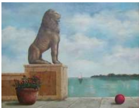
Lionel Kalish (1931) „Lion and Sailboat“ öl auf Leinwand, 1990 40,5 x 51 cm Lager-Nr. BE 4026