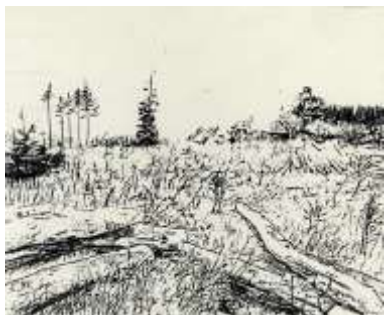
11. Wolfgang Mattheuer (1927-2004) "Holzplatz" 1976 Bleistiftzeichnung 70 x 84,8 cm Wvz. 78 Lager-Nr. BE 2652