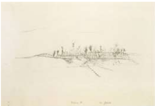
27. Gerhard Altenbourg (1926-1989) "Diese Geländewellen" 1962 Lithografie auf Büttenkarton 42 x 59 cm Ex. 10/10 Wvz.-Nr. L 75 Lager-Nr. BE 4381