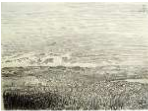
8. Wolfgang Mattheuer (1927-2004) "Elstertal" 1982 Bleistiftzeichnung 24,2 x 32,8 cm Lager-Nr. BE 2657