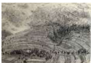
12. Wolfgang Mattheuer (1927-2004) "Am Fichtelberg" 1955 Lithokreide 21 x 30 cm Lager-Nr. BE 2666