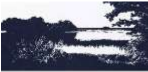
6. Bertram Hasenauer (geb. 1970) „Untitled“ 2010 Farbstift auf Papier 32 x 62 cm Lager-Nr. BK 16217