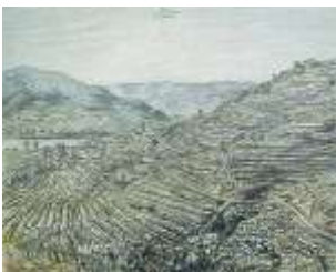
10. Wolfgang Mattheuer (1927-2004) "Weinberge bei Dürnstein" 1983 Bleistift, Ölpastell, Wasserfarbe, grundiert 24,8 x 31,5 cm Wvz. 196 Lager-Nr. BE 2660