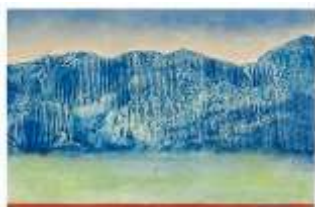
15. Max Ernst (1891-1976) "Montagne bleue - Wüstenlandschaft" 1950 Gouache auf festem Velin 16,3 x 23,9 cm wird in den Supplementband des Wvz. aufgenommen, Arbeitsnummer 256 A Seite 3/6