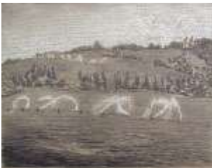
9. Wolfgang Mattheuer (1927-2004) "Landschaft mit Beregnungsanlage" 1985 Bleistift und Farbstift auf Papier 25,2 x 33 cm Wvz. 213 Lager-Nr. BE 2662